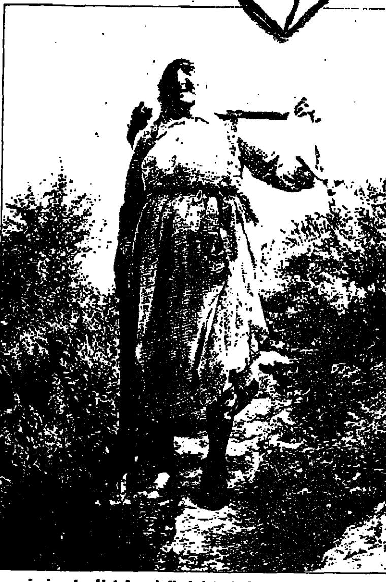
عكازها بيد ومعملها على كتفها الجنوب أرضنا وما يعرف غيره

من المياه المتساقطة وبإختلاف انحدار الأرض نفسها ونسوع تربتها . ويحدث الثاني بفعل الهواء الذي يسبب عواصف العمار . وما أكثر حدوث النوعين في بلدنا العربية ؛ وكل الخسائر نجم عن اتقاد الإنسان على تعرية التربة من الزرع والنباتات والإشجار وتركها تحت رحمة الأمطار والأعاصير .. وكثيرا ما سمعنا أن المزارع أو القرى القريبة من تلك المواقع قد هجرها أصحابها لكثرة زوايع التراب وغداحة أثار السيول . وهناك انجراف تشري تضرر به الأرض طبقة خفيفة متساوية السمك على جميع سطحها ، وهذا لا يضر من انجراف تربتها ، وهذا النوع الخضر فهو الذي يحدث الخنادق والأخاديد في الأرض ويسبب الخسارة الفادحة . لكن الطبيعة تسمى دائما للأبقاء على توازن عناصرها ، فعندما تروي المياه الأرض تيب الحياة النباتية فيها بسرعة . ويكون الانجراف أحيانا تشريا أي أن الأرض تضرر كسببات متساوية من التراب عن سطحها ، وهذا النوع دائم الحدوث ولا